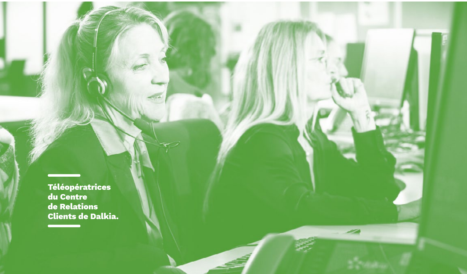
Téléopératrices du Centre de Relations Clients de Dalkia.