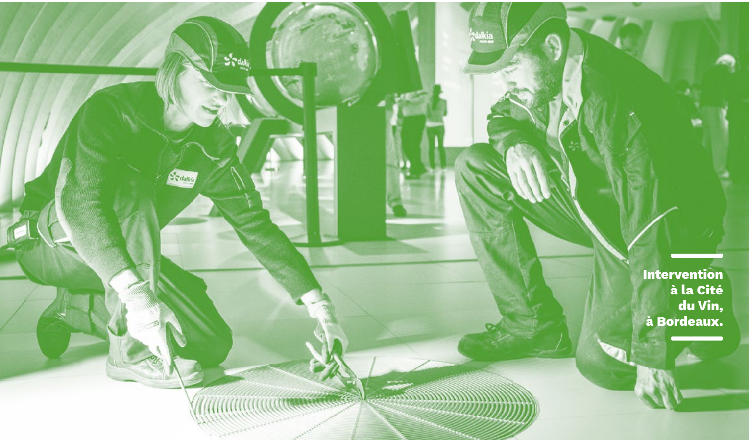
Intervention à la Cité du Vin, à Bordeaux.