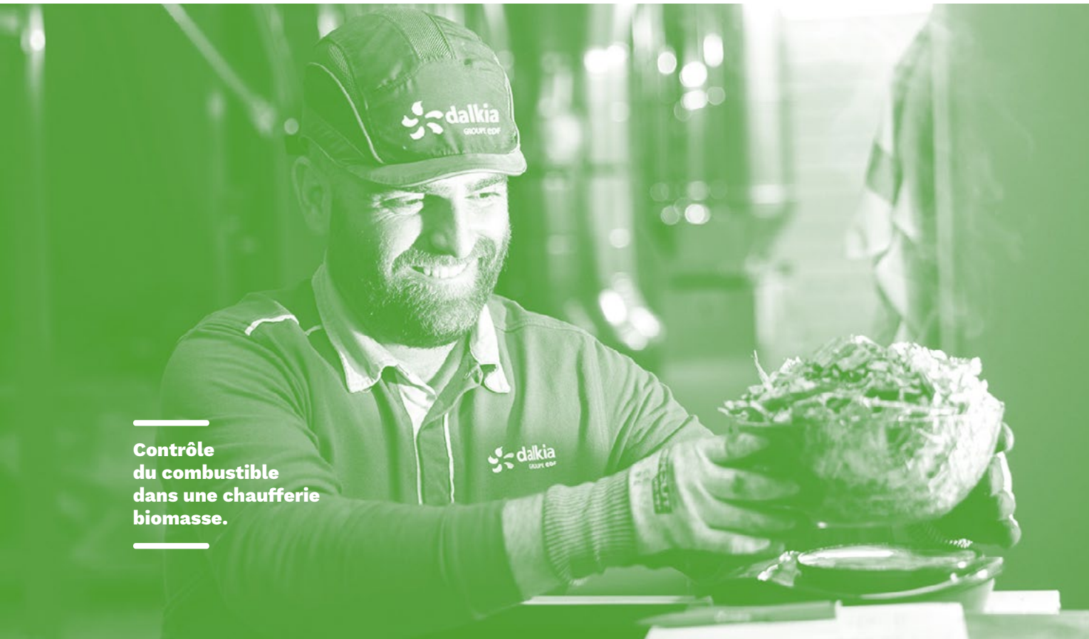
Contrôle du combustible dans une chaufferie biomasse.