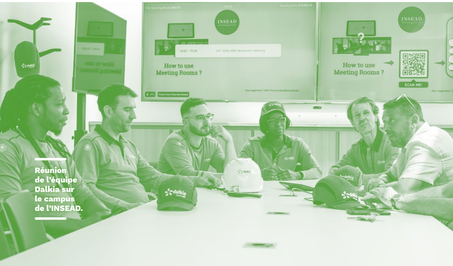
Réunion de l'équipe Dalkia sur le campus de l'INSEAD.